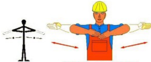
Halte - GEFAHR