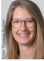
Astrid Geschwind, Schuldezernentin bei der Bezirks- regierung Köln