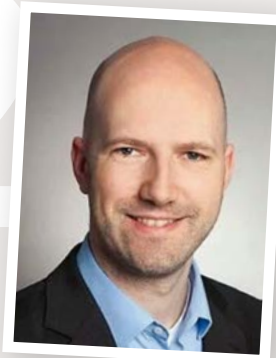
Stefan Otto

Vielmehr können sie dazu beitragen, etwas an der Schutzvorrichtung oder den Abläufen so zu verbessern, dass sie weniger störend wirken. Beides zusammen – auf