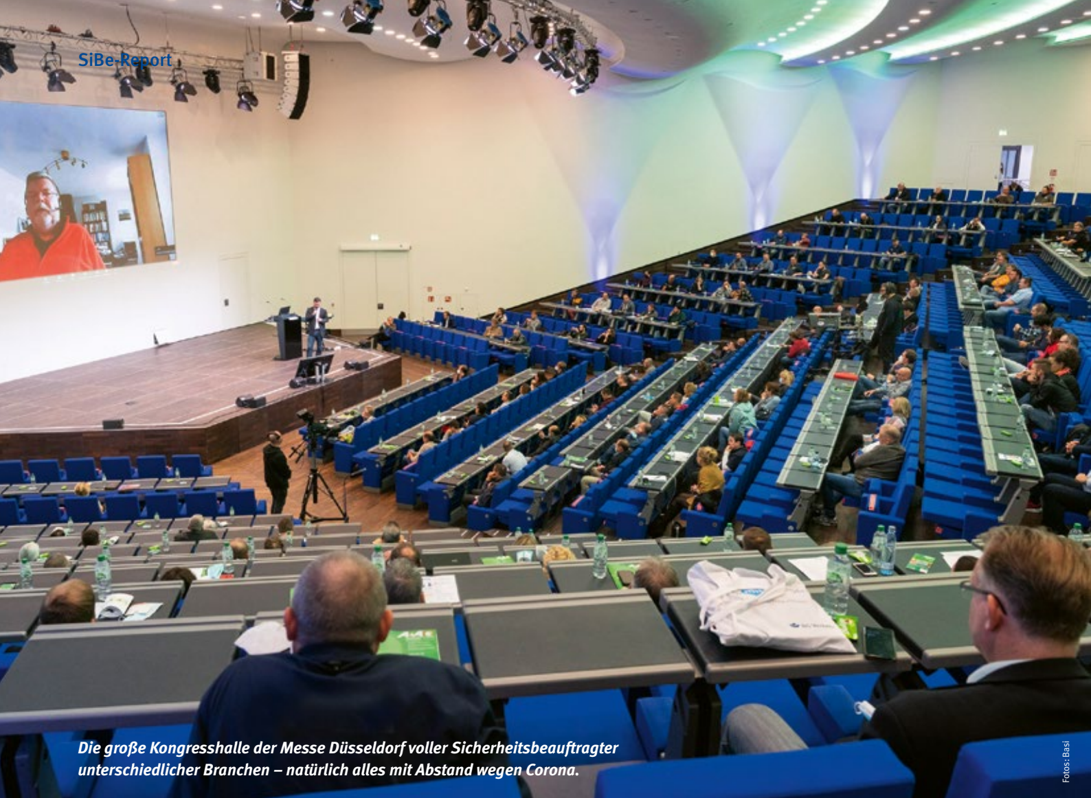
Die große Kongresshalle der Messe Düsseldorf voller Sicherheitsbeauftragter unterschiedlicher Branchen – natürlich alles mit Abstand wegen Corona.