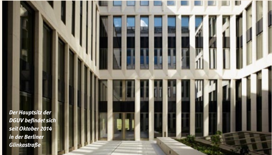
Der Hauptsitz der DGUV befindet sich seit Oktober 2014 in der Berliner Glinkastraße

Im ausgehenden 19. Jahrhundert gegründet, ist die gesetzliche Unfallversicherung ein wichtiger Grundpfeiler der sozialen Sicherungssysteme in Deutschland. Heute sind Arbeitnehmer, Auszubildende, Schüler in allgemein- und berufsbildenden Schulen, Studierende, Kinder in Tageseinrichtungen, aber auch Feuerwehrleute, Haushaltshilfen oder ehrenamtlich Tätige gesetzlich unfallversichert – insgesamt mehr als 75 Millionen Menschen. Charakteristisch für die Organisationsstruktur der DGUV ist die Selbstverwaltung und die Mitbestimmung. Die Mitgliederversammlung aus Vertretern der Berufsgenossenschaften und Unfallkassen wählt den Vorstand der DGUV und überträgt dem Ver-