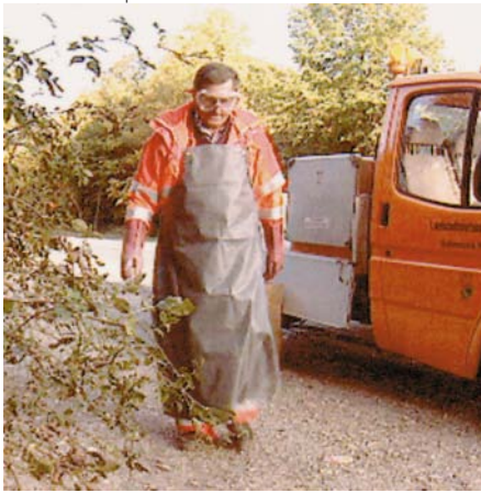
Einsammeln von Behältnissen mit unbekanntem Flüssigkeiten

Genauso wie Flüssigkeiten unbekannter Herkunft und Zusammensetzung auf öffentlichen Parkplätzen und in Waldstücken