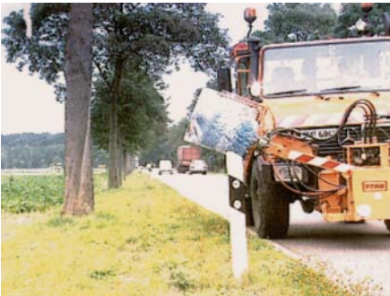
Leitpfostenwaschgerät im Einsatz

Insbesondere zu Zeiten, in denen die Straßen stark verschmutzt werden, also im Frühjahr während Tauperioden, im Herbst zur Erntezeit in ländlichen Gebieten und im Umfeld von Baustellen verschmutzen die Leitpfosten sehr schnell, so dass deren Reflektoren nicht mehr wirksam sind. Leitpfostenwaschgeräte schaffen hier Abhilfe. Da der Geräteträger, an dem das Gerät angebaut ist, im Einsatz etwa alle 50 m anhalten muss, tritt beim konventionellen