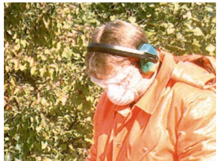
Voller Einsatz von persönlicher Schutzausrüstung mit Staubmaske

Ist darüber hinaus entsprechende Staubentwicklung zu erwarten, muss im Einzelfall die Ausrüstung noch um geeigneten Atemschutz, wie z.B. eine Staubmaske ergänzt werden.