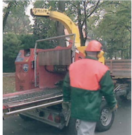
Einsatz eines Buschholzhackers

Für die Beseitigung von Betriebsstörungen jeglicher Art ist unbedingt zu beachten, dass der Antriebsmotor der Maschine abgestellt und eine vorhandene Hydraulikanlage drucklos gemacht wird, bevor in den Wirkbereich der Schneidwerkzeuge eingegriffen wird.