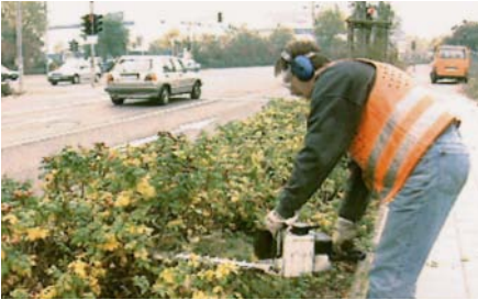
Heckenschneiden mit Motorgerät

Beim Heckenschneiden treten häufig Verletzungen auf, wenn sich die Beschäftigten an Dornen stechen, wenn ihnen Fremdkörper in die Augen fliegen oder wenn sie von Insekten, wie z.B. Wespen gestochen werden. Durch Einführung der Zweihandschaltung bei den Heckenscheren ist die Maschine selbst erfreulicherweise als Unfallursache ziemlich in den Hintergrund getreten. Die Tätigkeit stellt jedoch eine starke Belastung für die Wirbelsäule dar, da die Maschinen oft sehr schwer sind. Dies ist insbesondere dann der Fall, wenn sie mit einem Verbrennungsmotor ausgestattet sind.