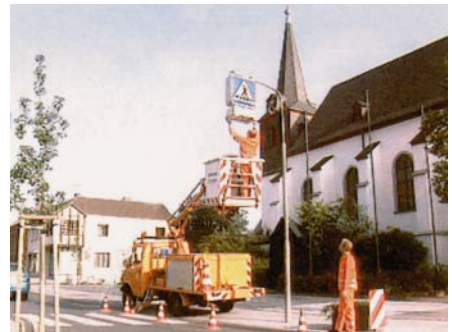
Lampenwechsel an der Beleuchtung eines Fußgängerüberweges

Die Wartung der Beleuchtungseinrichtungen muss im Allgemeinen auch vom Bauhofpersonal vorgenommen werden. Hängen diese in größeren Höhen, sind Hubarbeitskörbe oder Arbeitsplattformen an umgerüsteten Baumaschinen zu verwenden. Provisorien, die für den Wechsel einzelner Lampen „schnell“ einmal erhalten müssen, wie z.B. die Schaufel eines Radladers, sind