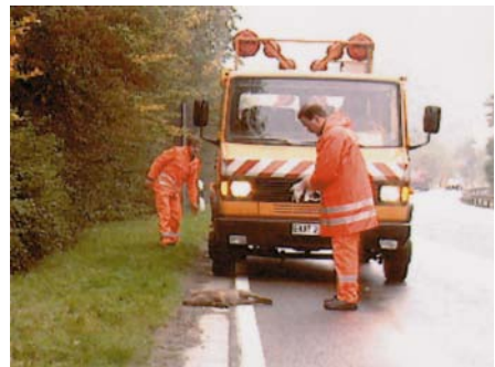
Einsammeln von Tierkadavern

Tiere, die überfahren wurden, müssen von der Straße entfernt werden. Auch hierfür werden in den Bundesländern unterschiedliche Verfahren angewendet. Vielfach ist es notwendig, dass das Unterhaltungspersonal die Kadaver einsammeln und in Beseitigungsanstalten bringen muss. Entsprechende Schutzausrüstung ist dafür von den Straßenwärtern im Fahrzeug mitzuführen.