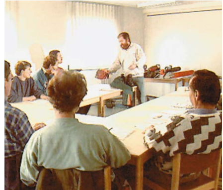
Unterweisung vor Beginn der Arbeiten mit der Motorsäge

Kenntnisse zur Verhütung von Arbeitsunfällen sowie arbeitsbedingten Gesundheitsgefahren zu vermitteln oder aufzufrischen.