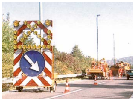
Sicherung einer Arbeitsstelle auf einer Bundesautobahn

Je nach Dauer der Verkehrsbehinderung ist naturgemäß der Aufwand für die Absicherung unterschiedlich. Für Baustellen liefert die RSA detaillierte Aussagen, die auf die verschiedenen Anforderungen auf Bundesautobahnen, sowie auf Straßen außerhalb und innerhalb von Ortschaften eingehen. Arbeitsstellen, die am Ende des Arbeitstages wieder abgebaut werden, sind im Allgemeinen auch in ihrer Länge begrenzt und dadurch überschaubar.