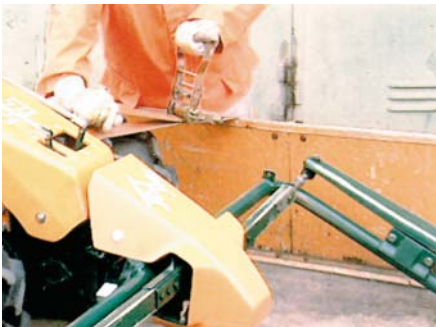
Verzurren einer fahrbaren Maschine mittels Zurrgurt und Spannvorrichtung.

Für den sicheren Transport müssen Lasten auf der Ladefläche sicher befestigt werden. Vor allem fahrbare Maschinen müssen während der Fahrt und insbesondere bei Bremsungen so gesichert sein, dass sie sich nicht selbstständig bewegen können. Hierfür sind viele neuere Transportfahrzeuge bereits mit entsprechenden Ösen ausgerüstet, um ein sicheres Verzurren zu ermöglichen. Fehlen solche Einrichtungen, stellen Zurrgurte mit Spannvorrichtung, die um die gesamte Ladefläche einschließlich Ladung gespannt werden, eine gute Hilfe dar.