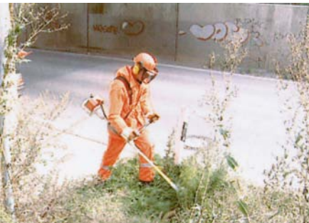
Volle Schutzausrüstung beim Umgang mit der Motorsense

Üblicherweise sind die Beschäftigten im Unterhaltungsdienst mit folgenden persönlichen Schutzausrüstungen ausgestattet: