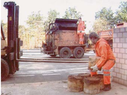
Richtiges Heben schwerer Lasten aus den Knien heraus mit geradem Rücken

schwerer Granitbordsteine verstärkt dabei die einseitige Belastung der Wirbelsäule erheblich. Des Weiteren sind die Gebinde für Baustoffe, Bitumen, Salz etc. des öfteren noch nicht auf kleinere Größen umgestellt.