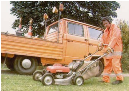
Gehörschutz beim Umgang mit lauten Maschinen

Besondere Bedeutung kommt dem Gehörschutz dann zu, wenn ihn Fahrzeugführer (z.B. von selbstfahrenden Arbeitsmaschinen) während der „Teilnahme am Straßenverkehr“ tragen müssen: Hierbei ist es notwendig, dass die Signaldurchlässigkeit des Gehörschutzes gewährleistet sein muss. Vom BIA (=Berufsgenossenschaftliches Institut für Arbeitsschutz und Arbeitsmedizin, St. Augustin) eigens daraufhin geprüfte Gehörschützer erfüllen diese Anforderungen.