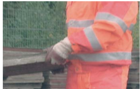
Reflexstreifen auf einem Warnanzug.

Darüber hinaus muss Warnkleidung auch bei schlechten Sichtverhältnissen und bei Dunkelheit vom Fahrer eines Fahrzeuges gut wahrgenommen werden können. Dazu dienen insbesondere Streifen aus retroreflektierenden Materialien, die zur Erhaltung ihrer Eigenschaften auch entsprechend sachkundiger Pflege bedürfen. Reflexstreifen vertragen im Allgemeinen keine hohen Temperaturen. Deshalb darf Warnkleidung nicht zur Kochwäsche gegeben werden. Die auf dem Einnäher jedes Wäschestücks der Warnkleidung aufgedruckte Waschanleitung gibt über die erforderlichen Einzelheiten Auskunft.