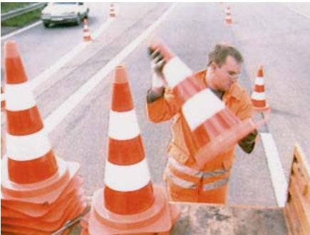
Absperren des Arbeitsbereiches mit Leitkegeln

bildet die rückwärtige Sicherung der eigentlichen Arbeitsstelle. Hier ist darauf zu achten, dass bei höheren Ausbaugeschwindigkeiten der Straße möglichst schwere Fahrzeuge zum Einsatz kommen, um bei einem Aufprall möglichst viel Masse entgegenzusetzen zu können. In vielen Regionen gibt es die Anweisung, dass Zugfahrzeuge der Warnleitanhänger nicht nur schwere LKW sein müssen, sondern, dass diese auch noch bis zur Grenze ihrer Tragfähigkeit beladen zu sein haben. Zum Beispiel wird dieser Forderung dadurch entsprochen, dass das Zugfahrzeug des Warnleitanhängers mit dem zugehörigen Streuautomaten für den Winterdienst ausgerüstet und dieser wiederum voll mit Streusalz befüllt wird.