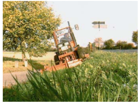
Kleintraktor bei Mäharbeiten

Kleintraktoren mit Mähwerk erleichtern die Bearbeitung größerer Flächen in erheblichem Maß. Durch die Ausrüstung mit Fahrerkabinen ist darüber hinaus für die Beschäftigten eine wesentliche Entlastung von Einflüssen durch Lärm, Staub und Witterung möglich.