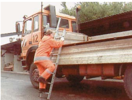
Aluminium-Leiter mit rutschhemmenden Stollen und Holmverlängerung

Wenn das Fahrzeug von Hand be- oder entladen werden muss, fallen verschiedene Arbeiten direkt auf der Ladefläche der Fahrzeuge an. So ist z.B. das Ladegut zu verzurren oder es sind Maschinen und Geräte platzsparend zu verstauen. Hierfür sollten im Bereich der Bordwände geeignete Aufstiegshilfen fest angebracht sein, denn nicht immer ist eine Leiter zur Stelle. So rutschen z.B. die Beschäftigten häufig ab, wenn sie über die Hinterräder aufklettern oder direkt