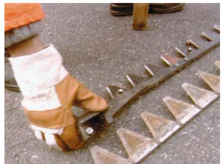
Schutzhandschuhe beim Handhaben von Mähmessern

Verboten ist dagegen der Gebrauch von Schutzhandschuhen bei Arbeiten an Kreissäge oder Ständerbohrmaschine. Hier ist die Gefahr, beim Hängenbleiben mit dem Handschuh von der Maschine erfasst und eingezogen zu werden höher anzusetzen, als die Gefahr sich am Werkstück zu verletzen.