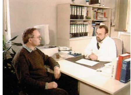
Regelmäßige Betreuung der Beschäftigten durch den Betriebsarzt

Die Gehörschäden stellen dabei die größte Gruppe dar. Dies liegt naturgemäß daran, dass die meisten, im Unterhaltungsdienst eingesetzten Maschinen und Geräte einen entsprechend hohen Lärmpegel verursachen. So liegen z.B. Motorsägen und Trennschneider häufig bei etwa 105 dB(A).