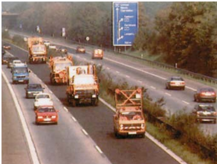
Einrichtung einer Wanderbaustelle auf einer Bundesautobahn

(Gleitschutzwand) gegen den direkten Anprall von Fahrzeugen zu sichern. Da jedoch die Revision einer Brücke im Allgemeinen innerhalb eines Tages abgeschlossen ist, sind nur leichte Abschränkungen und die Sicherung durch Warnleiteinrichtungen realisierbar.