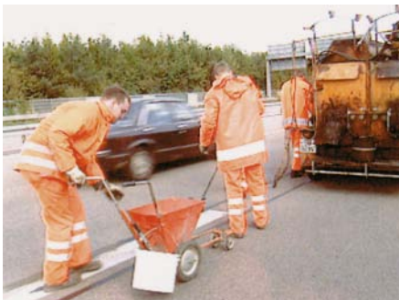
Fugenvergussarbeiten unter Verkehr

Nicht ohne Probleme sind Wartungs- und Reparaturarbeiten dann, wenn sie in unmittelbarer Nähe vorbeifahrender Fahrzeuge durchgeführt werden müssen. So kommt es z.B. bei Arbeiten an den Fahrbahnfugen