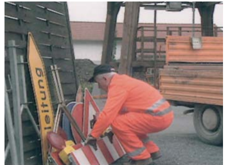
Heben von Lasten aus der Hocke heraus.

Besondere Bedeutung kommt, wie in vielen anderen Bereichen des Arbeitsschutzes auch, im Straßenunterhaltungsdienst dem Heben und Tragen schwerer Lasten zu. So müssen vielfach Fahrzeuge von Hand be- und entladen werden. Dies trifft insbesondere für die Lieferwagen zu, die häufig von den motorisierten Straßenwärtern benutzt werden, und die vielfach auch bei den Kommunen auf Grund ihrer Wendigkeit und Flexibilität zum Einsatz kommen. Sie sind im Allgemeinen nicht mit Hilfseinrichtungen, wie z.B. einem Ladekran ausgestattet.