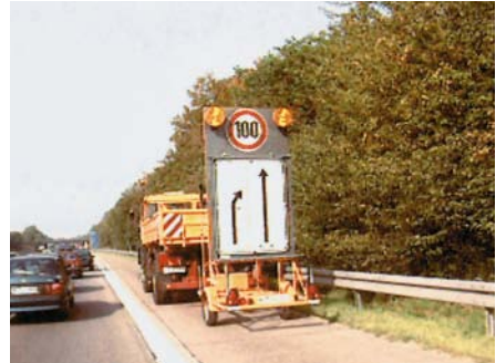
Vorwarntafel als Hinweis auf eine Arbeitsstelle

Wanderbaustellen sind in ihrer Einrichtung immer sehr problematisch, da nur ein geringer Aufwand zur Absicherung getrieben werden kann und sich zudem der gesamte Tross mit Schrittgeschwindigkeit weiterbewegt. Die Abstände zwischen Sicherungsfahrzeug und Arbeitsstelle dürfen dabei nicht zu klein und nicht zu groß sein. Bei zu kleinem Abstand besteht die Gefahr, dass im Falle eines Auffahrunfalles das Sicherungsfahrzeug in den Arbeitsbereich geschoben wird. Bei zu großem Abstand können Fahrzeuge nach dem Sicherungsfahrzeug wieder auf die gesperrte Fahrspur einscheren und auf die Arbeitsstelle prallen. Maße für die zu wählenden Abstände geben die RSA 95 in Abhängigkeit von Sichtweite und Ausbaugeschwindigkeit.