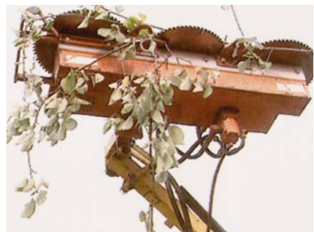
Spezialgerät zum Lichtraumprofil schneiden