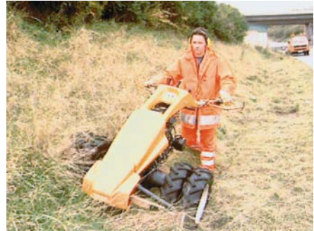
Arbeiten mit dem Balkenmäher auf Böschungen

Für diesen Einsatz fordern die einschlägigen Vorschriften besondere technische Ein-