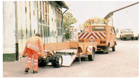
Auffahren eines Einachsschleppers auf einen Niederfluranhänger über eine speziell dafür konstruierte Bordwand.

sie vom Hersteller an zentraler Stelle oberhalb des Schwerpunkts mit einem entsprechenden Anschlagpunkt oberhalb des Schwerpunktes ausgerüstet wurden, in den der Kranhaken direkt eingehängt werden kann.