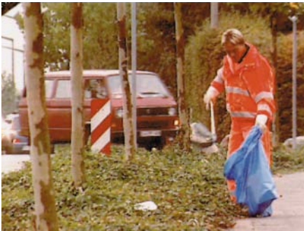
Einsammeln von Abfällen vor Grünpflegearbeiten

immer wieder Getränkedosen von Mähwerkzeugen erfasst und mit großer Wucht weggeschleudert. Kunststoffseile oder Stoffteile können sich um die Werkzeuge wickeln und dort durch Erwärmung so verkleben, dass ein Entfernen nahezu unmöglich wird.