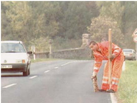
Für Arbeiten im Verkehrsbereich ist geeignete Warnkleidung lebenswichtig.

Alle Beschäftigten, die sich im Bereich des fließenden Verkehrs aufhalten, müssen rechtzeitig vom Verkehrsteilnehmer erkannt werden können. Hierfür muss Warnkleidung getragen werden, die den Anforderungen der DIN EN 471 entspricht.