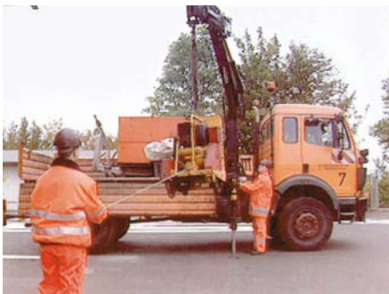
Angeschlagene Lasten von einer gesicherten Position aus führen.

Ohne Ladegeschirre lassen sich neuere Maschinen, wie z.B. Rüttelplatten, kleine Walzen und Kompressoren heben, wenn