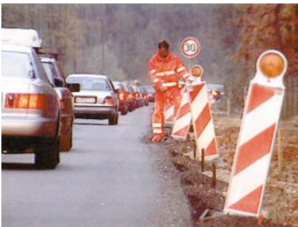
Warnkleidung in Tagesleuchtfarbe und mit retroreflektierenden Streifen.

ten Schutzhandschuhe aus grobem Gewebe mit Innenflächen aus Leder völlig ungeeignet, wenn z.B. mit Lösemitteln (Kraftstoff, Kaltreiniger, Verdüner, Tri) gearbeitet werden muss. Gleiches gilt für Schweißarbeiten aus Gründen der Brennbarkeit und Isolierung gegen Hitze. Dafür gibt es spezielle Handschuhe, die vollständig aus Leder und mit langen Stulpen gefertigt sind.