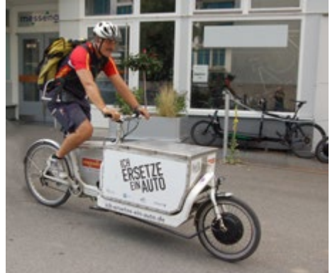
Abb. 15 Bei der Zustellung