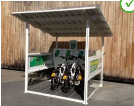
Abb. 17 Öffentliche Ladestation an einem Einkaufszentrum