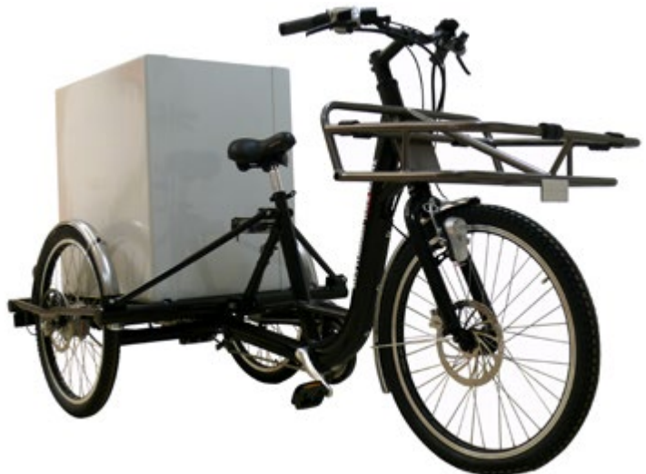
Abb. 3 Mehrspuriges Pedelec 25