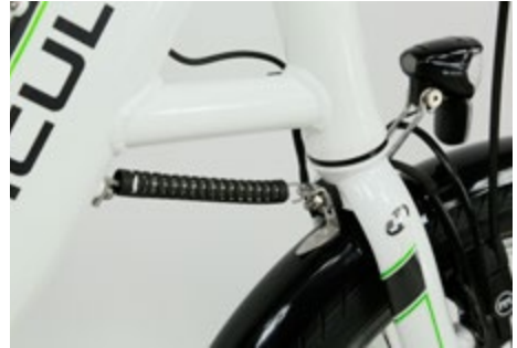
Abb. 10 Lenkungsdämpfer

Wird ein Pedelec 25 auf einem Zweibeinständer abgestellt, hat in der Regel das Vorderrad keinen Kontakt zum Boden und schwebt frei. Ein Lenkungsdämpfer stabilisiert die Vordergabel in Fahrtrichtung beim Abstellen und verhindert damit ein unkontrolliertes Verdrehen des Lenkers. Somit wird das Beschädigen von z. B. elektrischen Leitungen und Bowdenzügen vermieden.