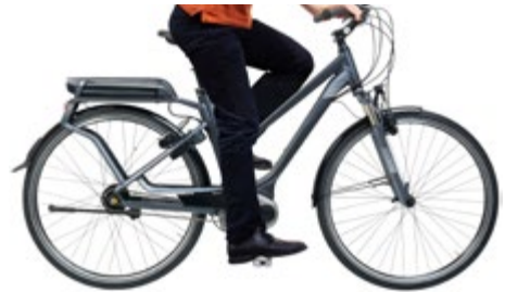
Abb. 14 Richtig eingestellte Sitzhöhe beim Tretvorgang

Die Einstellung der richtigen Sitzhöhe resultiert aus der Verstellung der jeweiligen Sattelhöhe. Die Sattelhöhe ist richtig eingestellt, wenn Sie – auf dem Sattel sitzend – mit den Fußballen beider Füße den Boden soeben erreichen können. Beim Tretvorgang selbst sollte das Bein im Kniegelenk nahezu vollständig gestreckt werden können. Die Sattelstütze darf maximal bis zu der jeweiligen umlaufenden Markierung herausgezogen werden. Hierbei ist die Mindesteinstecktiefe der Sattelstütze konsequent einzuhalten.