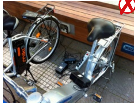
Abb. 18 Nicht empfehlenswert; Ladegeräte liegen auf dem Boden und sind über eine Mehrfachsteckdose unterverteilt (marktübliche Ladegeräte sind nur für die Benutzung in „trocknen Räumen“ geeignet)