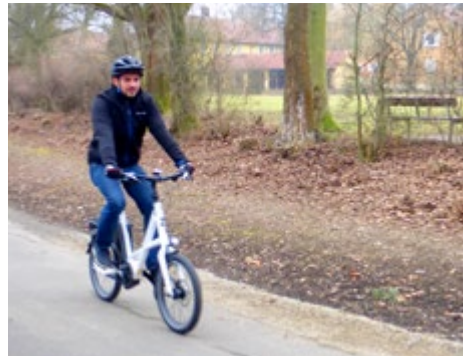
Abb. 16 Auf dem Weg zur Arbeit