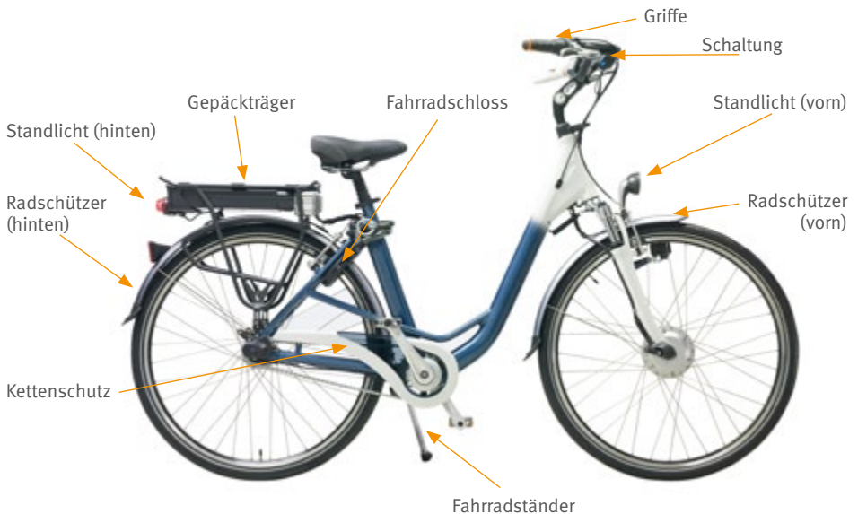
Abb. 9 Empfehlenswerte Zusatzausstattung des Pedelec 25