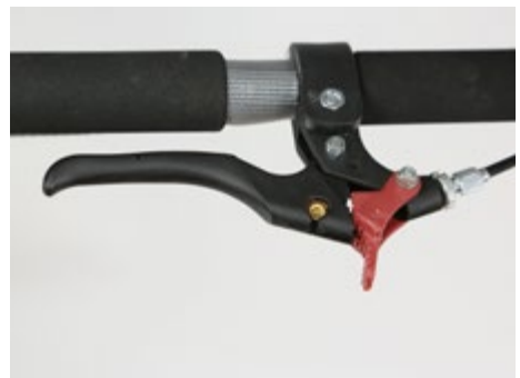
Abb. 12 Feststellbremse