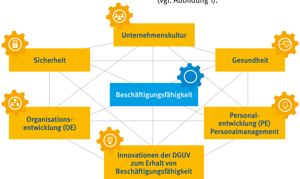
Abb. 1 Wichtige Einflussgrößen auf Beschäftigungsfähigkeit und ihre Querbezüge

Als Strukturierungshilfe der Schrift werden Themenbereiche herangezogen, welche für Betriebe und Bildungseinrichtungen sowie die gesetzliche Unfallversicherung von zentraler Bedeutung sind (vgl. Abbildung 1).