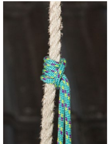
Abb. 5 Prusikknoten