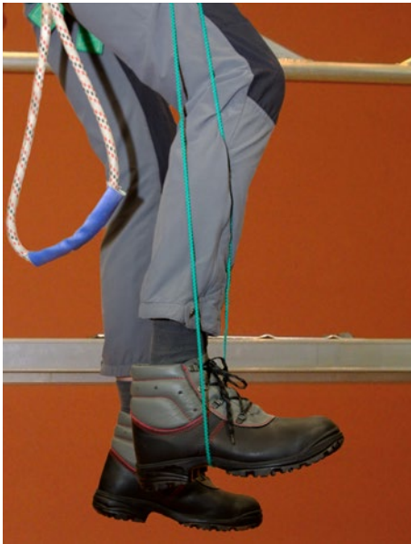
Abb. 2 Entlastung durch Stemmen eines Fußes in eine Trittschlinge

Solange eine Person noch handlungsfähig ist, kann sie unterschiedliche Maßnahmen ergreifen, um dem Blutstau in den Beinen entgegen zu wirken. Dazu ist es notwendig, dass die im Gurt hängende Person die Beine bewegt. Effektiver ist es, die Beine abzustützen und gegen einen Widerstand zu drücken. Hierfür sind Trittschlingen, z. B. ein Halteseil mit Längeneinstellvorrichtung oder eine Prusikschlinge geeignet. Damit kann sich die frei hängende Person entlasten, die „Muskelpumpe“ kann in Gang gehalten und eine eventuelle Einschnürung im Oberschenkel gelöst werden.