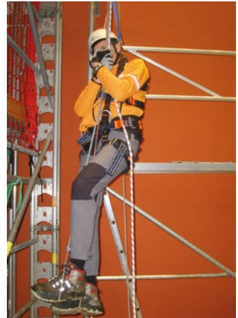
Abb. 4 Anwendung der Prusikschlinge

Die Prusikschlinge wird bereits vor Arbeitsbeginn für den „Ernstfall“ vorbereitet und leicht zugänglich und erreichbar – z. B. in einer Schutztasche am Auffanggurt – verstaut.